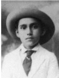
Oscar Arnulfo Romero sa narodil

do desaťčlennej rodiny 15. augusta 1917 v meste Ciudad Barrios, v Salvádore. Jeho otec bol poštar a niekedy mu mladý Romero pomáhal roznášať poštu. Oscar sa učil za tesára, vyrábať stoly, stoličky a dvere.